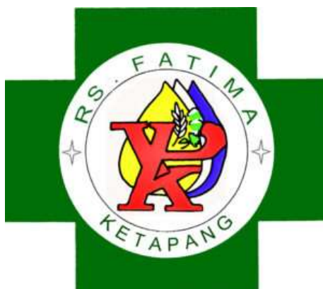
Gambar 4.1 Logo Rumah Sakit Fatima Ketapang