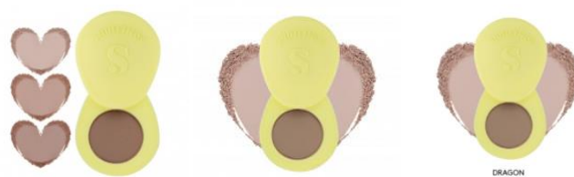
Contour & Bronzer.