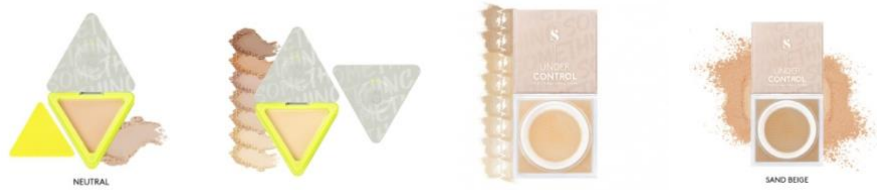
Compact & Loose Powder.