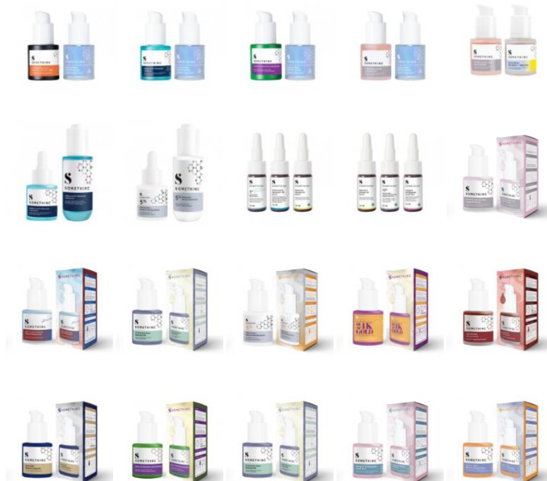
Gambar 4.2 Skin Solver Serum