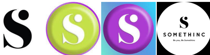
Gambar 4.1 Logo Produk Kecantikan Somethinc