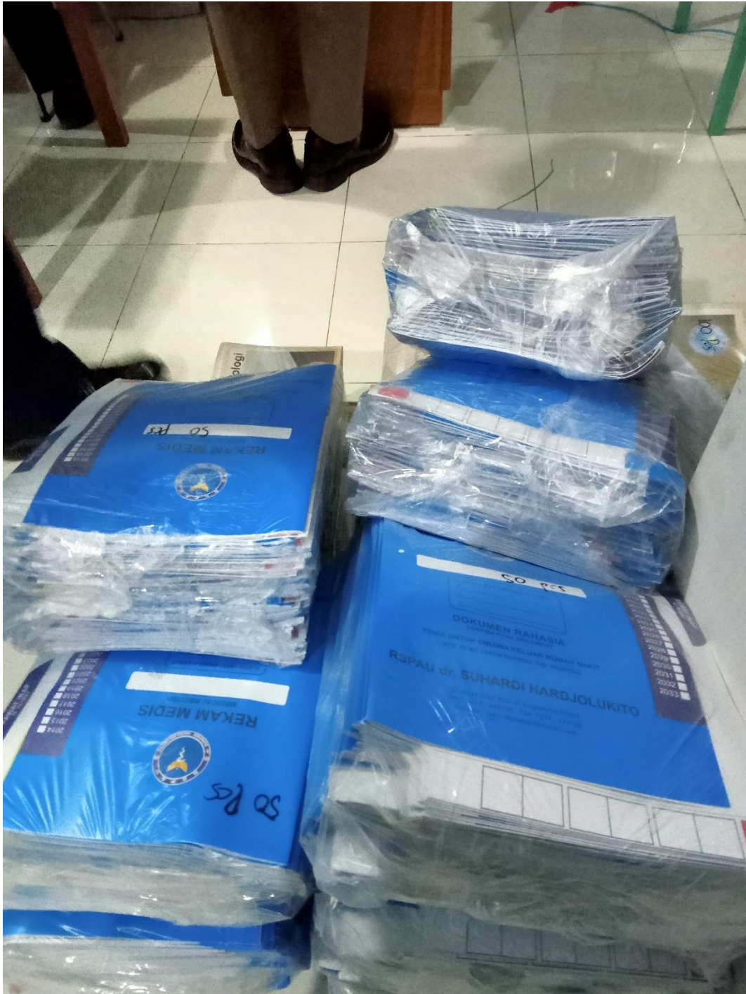
Stok barang masuk