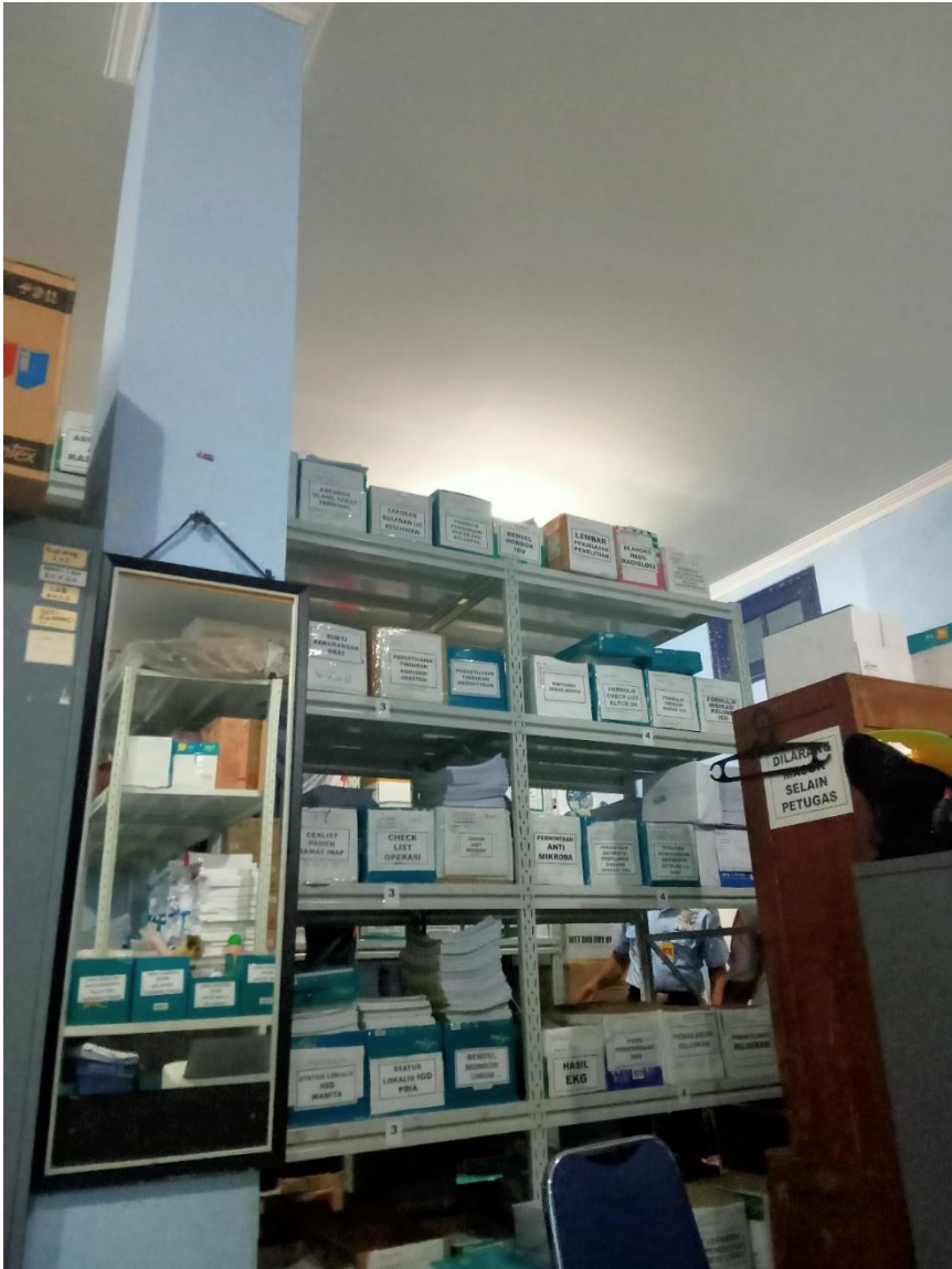
Rak dokumen dan barang material umum