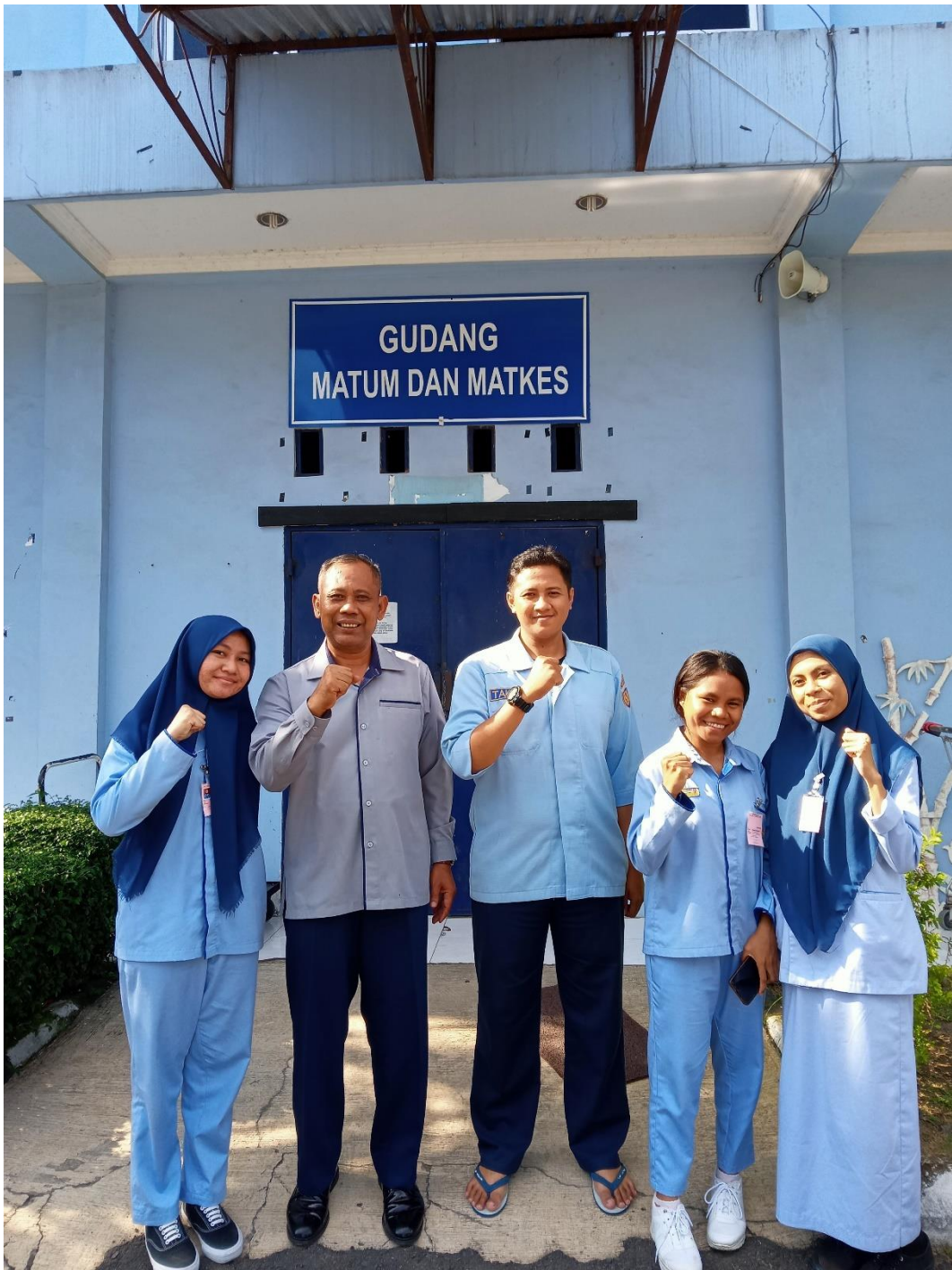
Mahasiswa dan staf gudang material umum