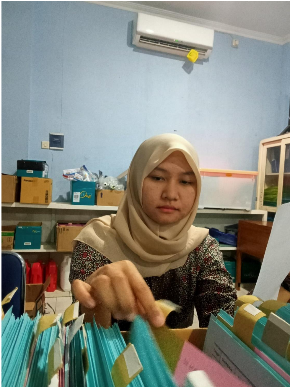
Pencarian kartu stok/kartu alokasi barang