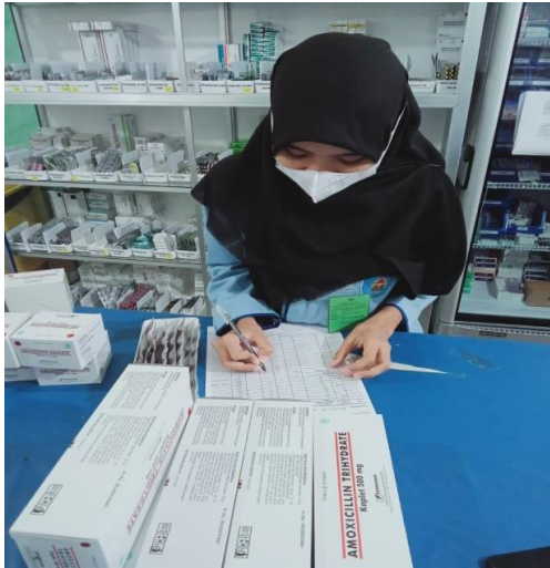
Lampiran 1. Kegiatan Penelitian Tugas Akhir